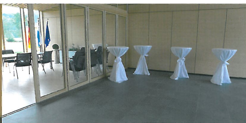
Foyer und Trauzimmer