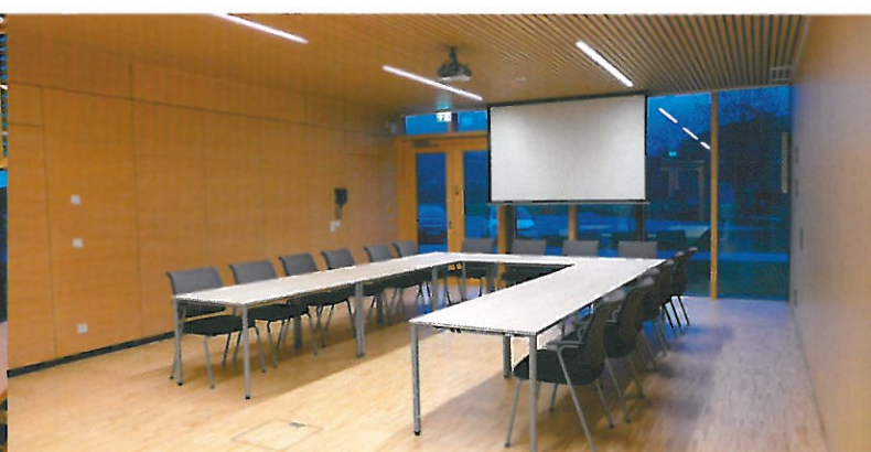
Sitzungsraum mit Trennwand zum Bürgersaal